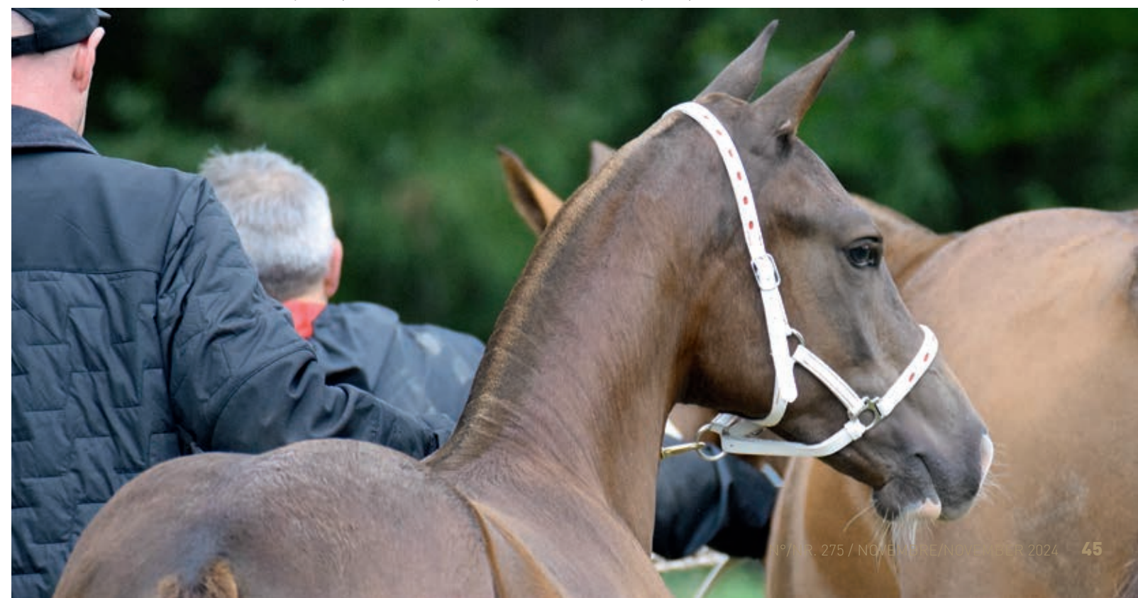
1. Platz für Casino du Pré de l'Idylle (Capéo/Nolo). / 1 re place pour Casino du Pré de l'Idylle (Capéo/Nolo).

Des 17 sujets présentés dans la seconde catégorie, quatre ont été admis au rappel. Le poulain Casino du Pré de l'Idylle (Capéo/Nolo) s'est hissé au premier rang avec un total de 24 points (8/8/8). Il appartient à Sébastien Collet de Suchy. A la deuxième place, on trouve Jolly Jumper (Don Flavio/Never BW),