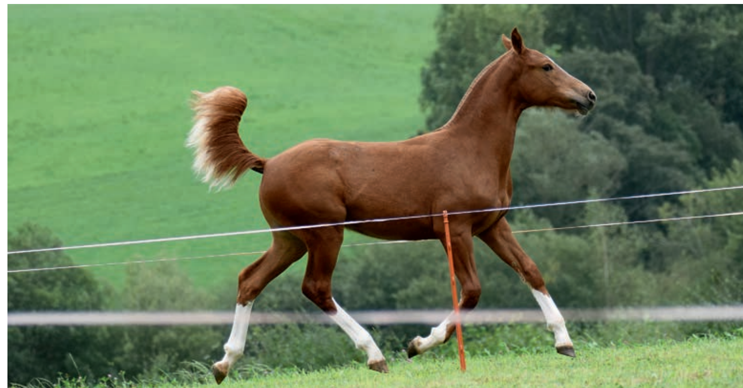
Deuxième place pour Ferrette de la Ravière (Captain/ Never BW). / Seconde place pour Ferrette de la Ravière (Captain/ Never BW).