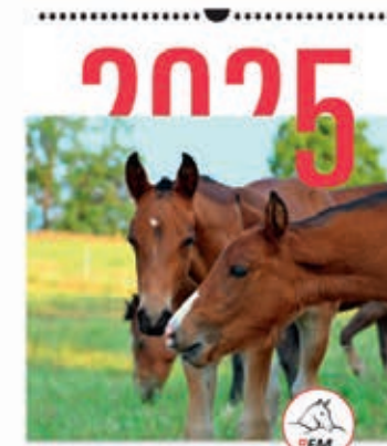
LE CHEVAL FRANCHES-MONTAGNES DAS FREIBERGERPFERD