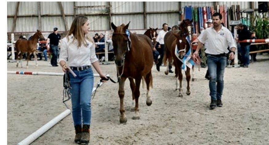
Die Züchter präsentierten ihre Tiere. / Les éleveurs présentent leurs chevaux.

pour les deux pouliches classées premières, donc seuls des détails ont décidé de la victoire entre Hailey vom Kappensand avec 8/7/7 et Don Dalera HRE avec 8/6/8. Avec une «bonne ligne supérieure, un fondement correct et un bon trot venant de l'arrière-main», c'est finalement Hailey vom Kappensand,