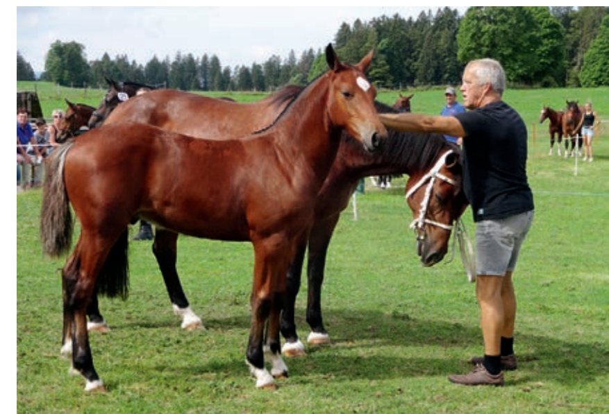
Au Peuchapatte, c'est le poulain Dix de Cœur par Don Falco et Ayun par Norway qui s'est imposé avec les notes de 8/7/8. / In Le Peuchapatte war es das Fohlen Dix de Cœur von Don Falco und Ayun von Norway, das sich mit den Noten 8/7/8 durchsetzte.