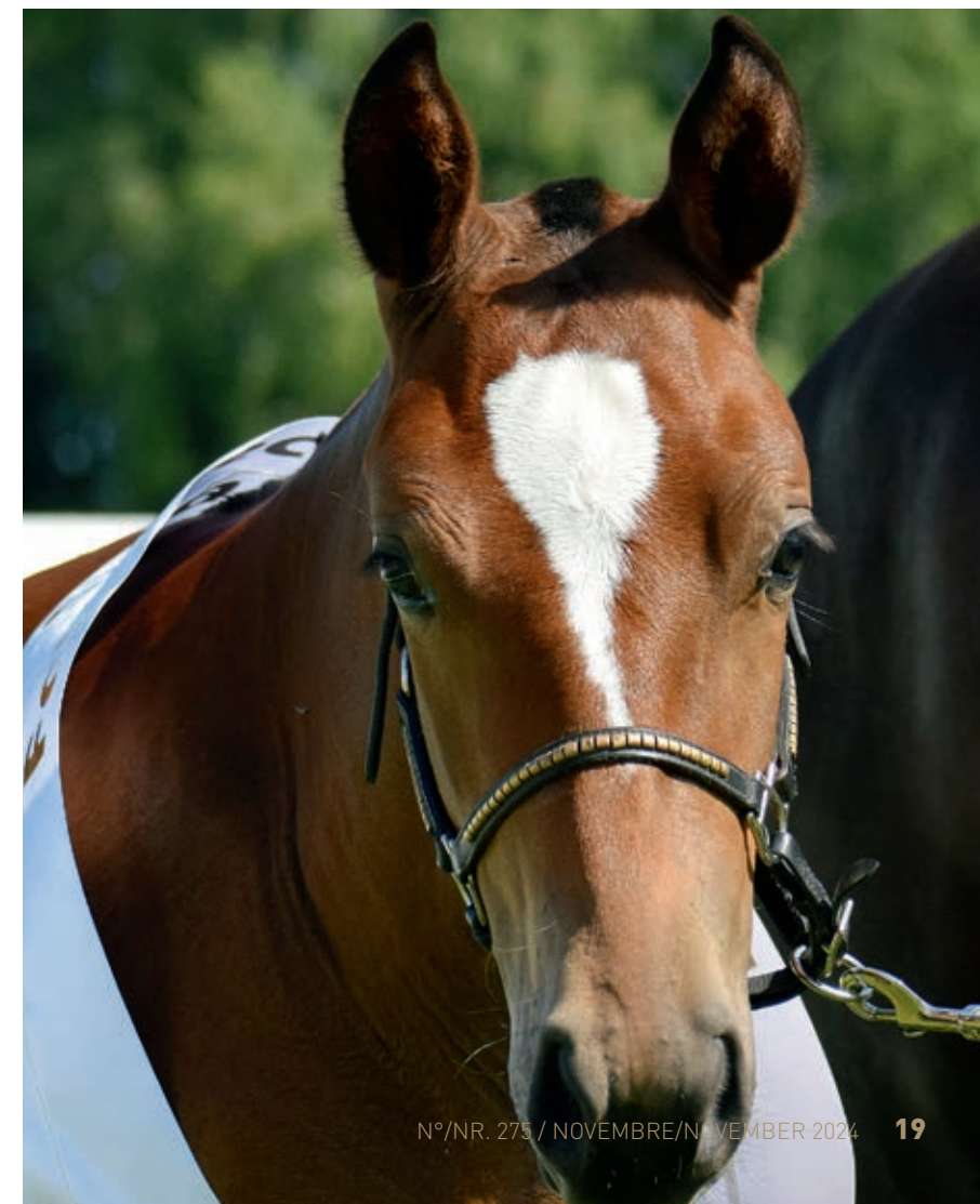
Hamina (Haloa/Don Fenaco) erhielt die Noten 9/8/9 und den 1. Rang. / Hamina (Haloa/Don Fenaco) a obtenu les notes 9/8/9 et le 1 er rang.

D'Amore aus Neuenegg, den letzten Rang. Laut den Richtern des Tages wurde eine schöne Palette von Pferden präsentiert. Die Züchter hatten sich sorgfältig um die Vorbereitung und Pflege ihrer Pferde gekümmert, um sie von ihrer besten Seite zu zeigen. Jeder Besitzer hatte die Möglichkeit, sein Pferd, wenn gewünscht, den jungen Schweizer Züchtern für die Präsentation anzuvertrauen.