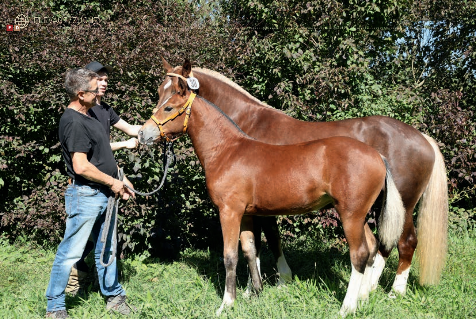
1 er rang pour la pouliche Lyra (Nordica de la Burgis) de Jürg Steffen de Rüegsbach. / 1. Rang für Stutfohlen Lyra (Nordica de la Burgis) von Jürg Steffen aus Rüegsbach.