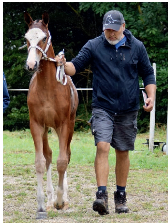
1 er rang de la catégorie des poulains plus jeunes: Cupidon du Pontet (Capéo/Helix). / 1. Platz in der Kategorie der jüngeren Fohlen: Cupidon du Pontet (Capéo/Helix).