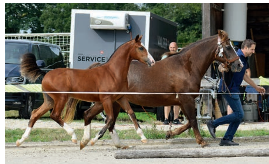
Every, Hengstfohlen von Event/L'Artiste gewann den 1. Platz bei den Hengstfohlen. / Every, jeune mâle par Event/L'Artiste a remporté la 1 re place chez les poulains.