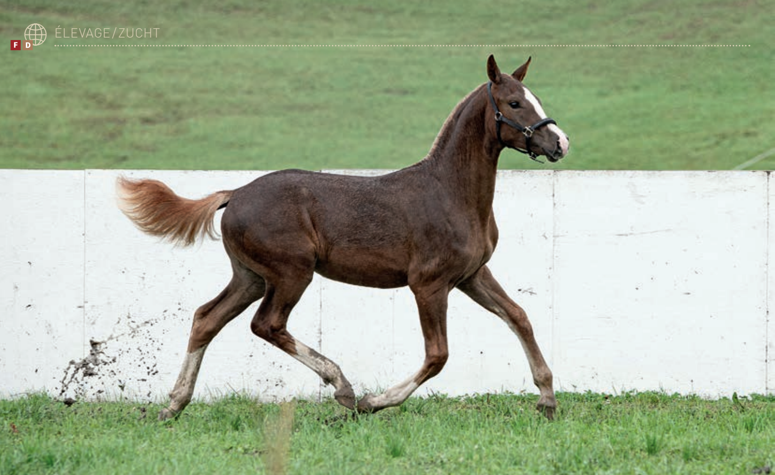
Gagnante des pouliches : Mayana (Narino vom Fribyhof/L'Artiste). / Siegerin der Stutfohlen : Mayana (Narino vom Fribyhof/L'Artiste).