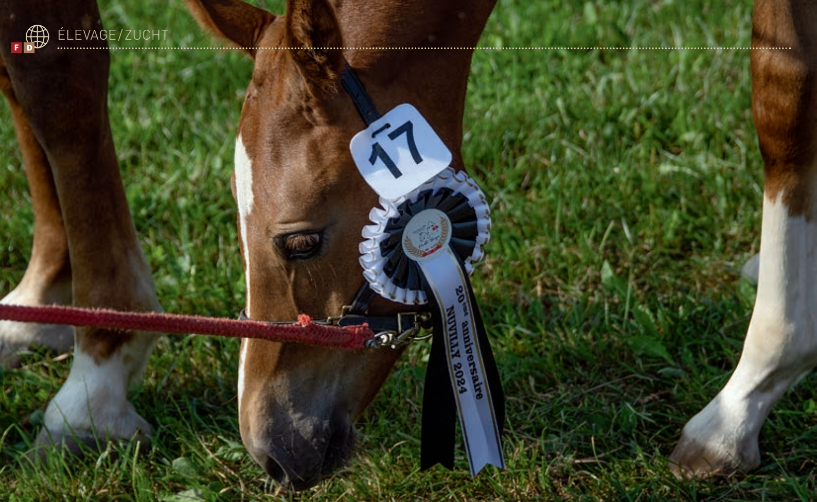
Lazare des Roches (Litchy/Hermitage), Sieger der Hengstfohlen. / Lazare des Roches (Litchy/Hermitage), vainqueur des poulains.

R'éclère/Happy-Day), a su convaincre les juges et était la première qualifiée pour le rappel. Finalement, huit pouliches se sont présentées au rappel et