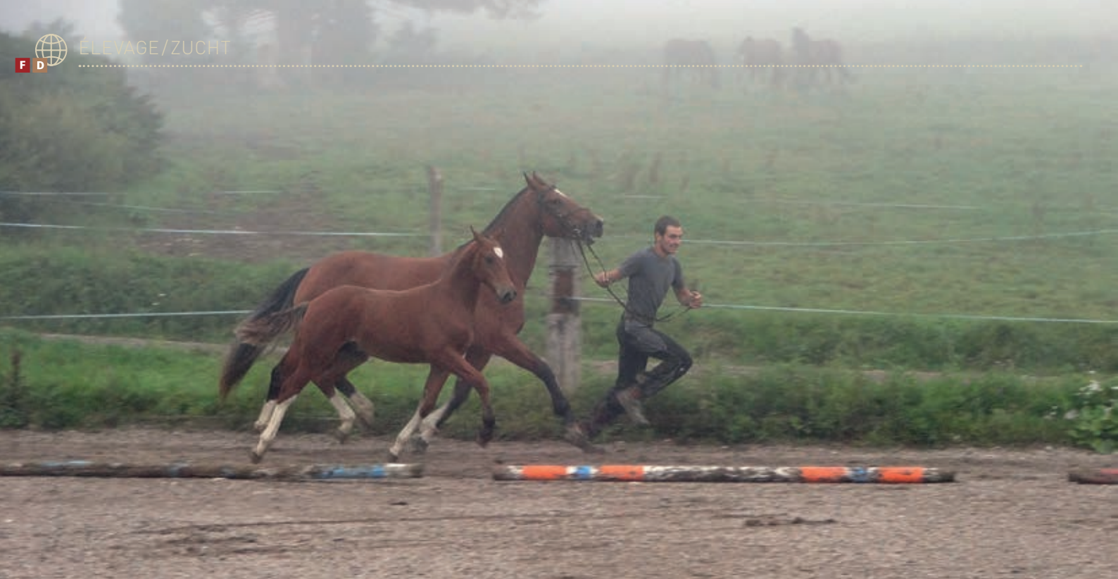
Dans le froid et la grisaille du concours du Syndicat neuchâtelois aux Vieux-Prés, les poulains de l'étalon Nevergold ont pris les 5 places du rappel en montrant avant tout des allures souples et dégagées. / In der kalten und grauen Umgebung der Schau der Neuenburger Genossenschaft in Les Vieux-Prés belegten die Fohlen des Hengstes Nevergold die fünf Plätze im Rappel und zeigten dabei vor allem weiche und raumgreifende Gänge.