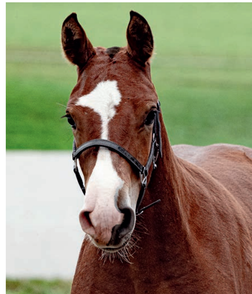
Champion der Hengstfohlen : Eron (Erode/Hermitage). / Champion des poulains mâles : Eron (Erode/Hermitage).

28. September 2024 – Pferdegenossenschaft Thurgau in Schönholzerswilen