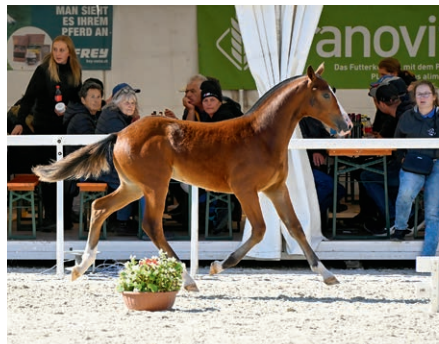
Gagnante de la catégorie des pouliches et poulains plus jeunes: Extra (Nordica de la Burgis/Hermitage). / Gagnante de la catégorie des plus jeunes Fohlen: Extra (Nordica de la Burgis/Hermitage).