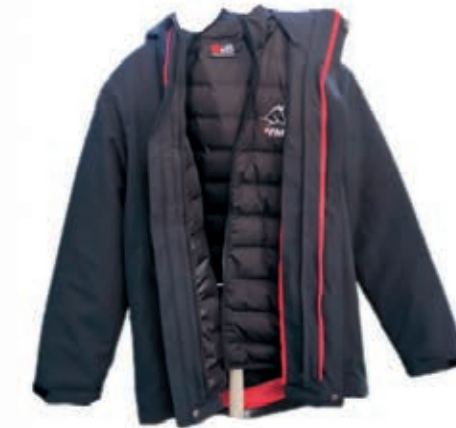
NOUVELLE VESTE D'HIVER 3 EN 1 NEUE WINTERJACKE 3 IN 1