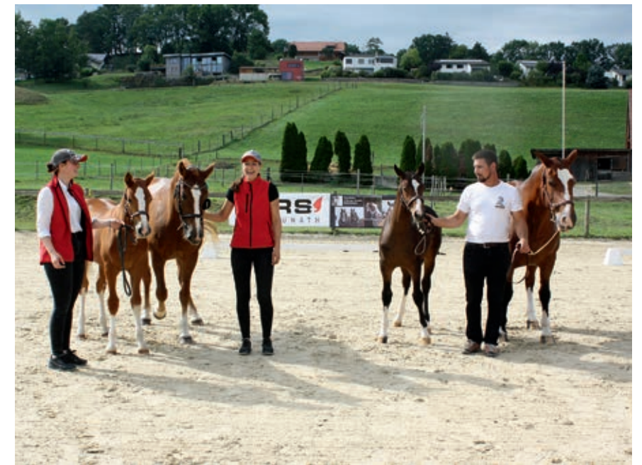
Aphrodite de la Sia (Never BW/Legato) à gauche et Extra (Expresso/Lyroi) à droite, les deux grands vainqueurs du jour. / Aphrodite de la Sia (Never BW/Legato) links und Extra (Expresso/Lyroi) rechts, die beiden grossen Tagessieger.