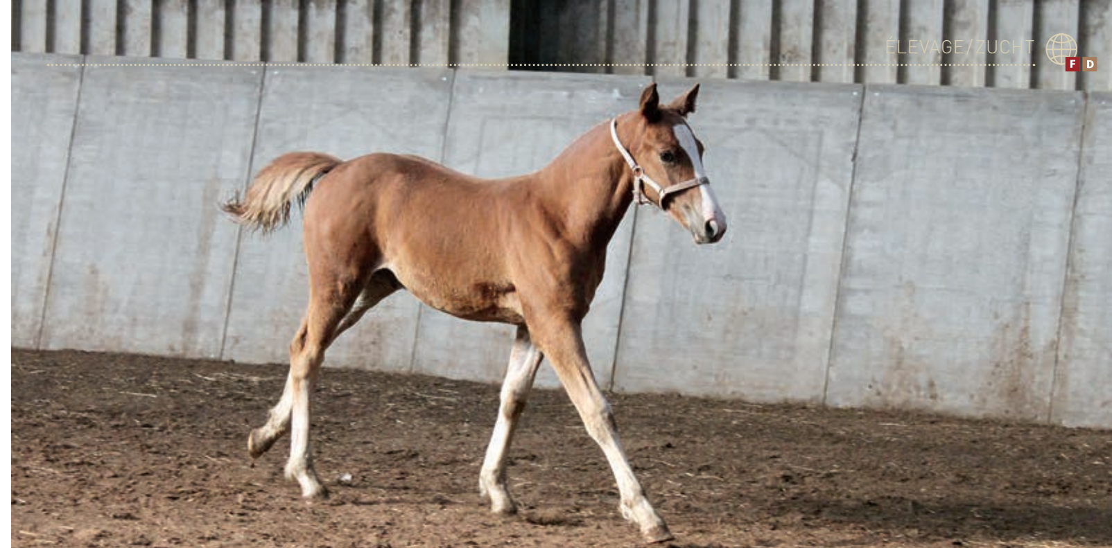
Cooper (Closer/Mère Nebraska [Nectar II]). / Cooper (Closer/Mutter Nebraska [Nectar II]).

Aujourd'hui, les Pays-Bas ont montré que la race des Franches-Montagnes joue un rôle de plus en plus important. L'élevage hollandais n'en est plus à ses balbutiements mais, en collaboration avec la Fédération suisse du franches-montagnes, il tente de réfléchir de manière professionnelle à l'élevage du franches-montagnes à l'étranger. De nouvelles lignées pour l'élevage néerlandais sont envisagées afin de garantir la diversité de la descendance. Tout en conservant, bien sûr, le caractère fantastique que Closer transmet à ses poulains!