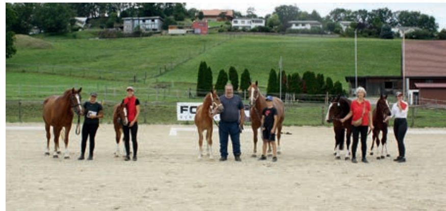
Rappel des pouliches: Aphrodite de la Sia (Never BW/Legato) au 1 er rang (milieu), 2 e place pour Eclipse (Lyroi/Névada) à gauche et 3 e place pour Dulcinea de la Sia (HappyBoy BW/Don Athos) à droite. / Stutfohlen-Rappel: Aphrodite de la Sia (Never BW/Legato) in der 1. Reihe (Mitte), 2. Platz für Eclipse (Lyroi/Névada) links und 3. Platz für Dulcinea de la Sia (Happyboy BW/Don Athos) rechts.

Une jeunesse bien conservée A la suite des poulains, deux étalons reproducteurs ont été présentés au public: Quarex (Quinto/Leader) qui est un étalon qui appartient aux frères Pasquier du Pâquier, ainsi que l'étalon Lyroi (Libero/Las Vegas) en propriété de Didier Barras de La Roche. Tous deux âgés de plus de 20 ans (Quarex est né en 1997 et Lyroi en 2002), ils n'ont rien perdu de leur panache! A en croire les juges ce jour-là, leur jeunesse si bien conservée serait due à l'air pur de la Gruyère! Pour clore la journée, une collation a permis d'échanger entre juges, éleveurs et visiteurs sur l'après-midi et ainsi de finir en beauté. Le comité a remercié les juges, les donateurs et toutes les personnes qui ont œuvré à la bonne marche du concours, sans oublier les familles d'éleveurs et les spectateurs.