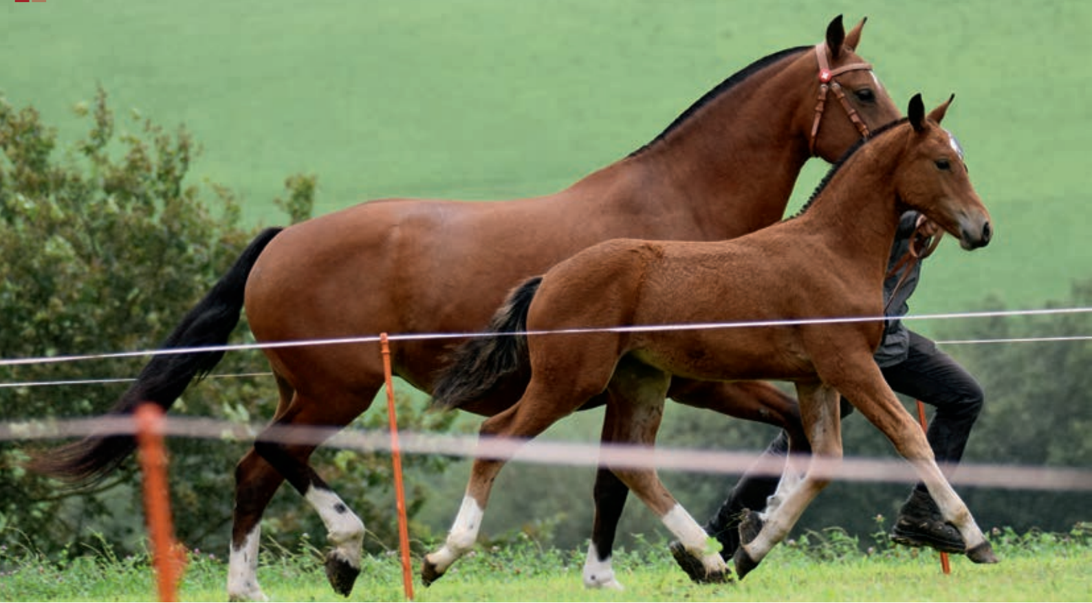
Le grand gagnant du concours, Européen (Edifice/Coventry). / Der grosse Gewinner der Fohlenschau, Européen (Edifice/Coventry).