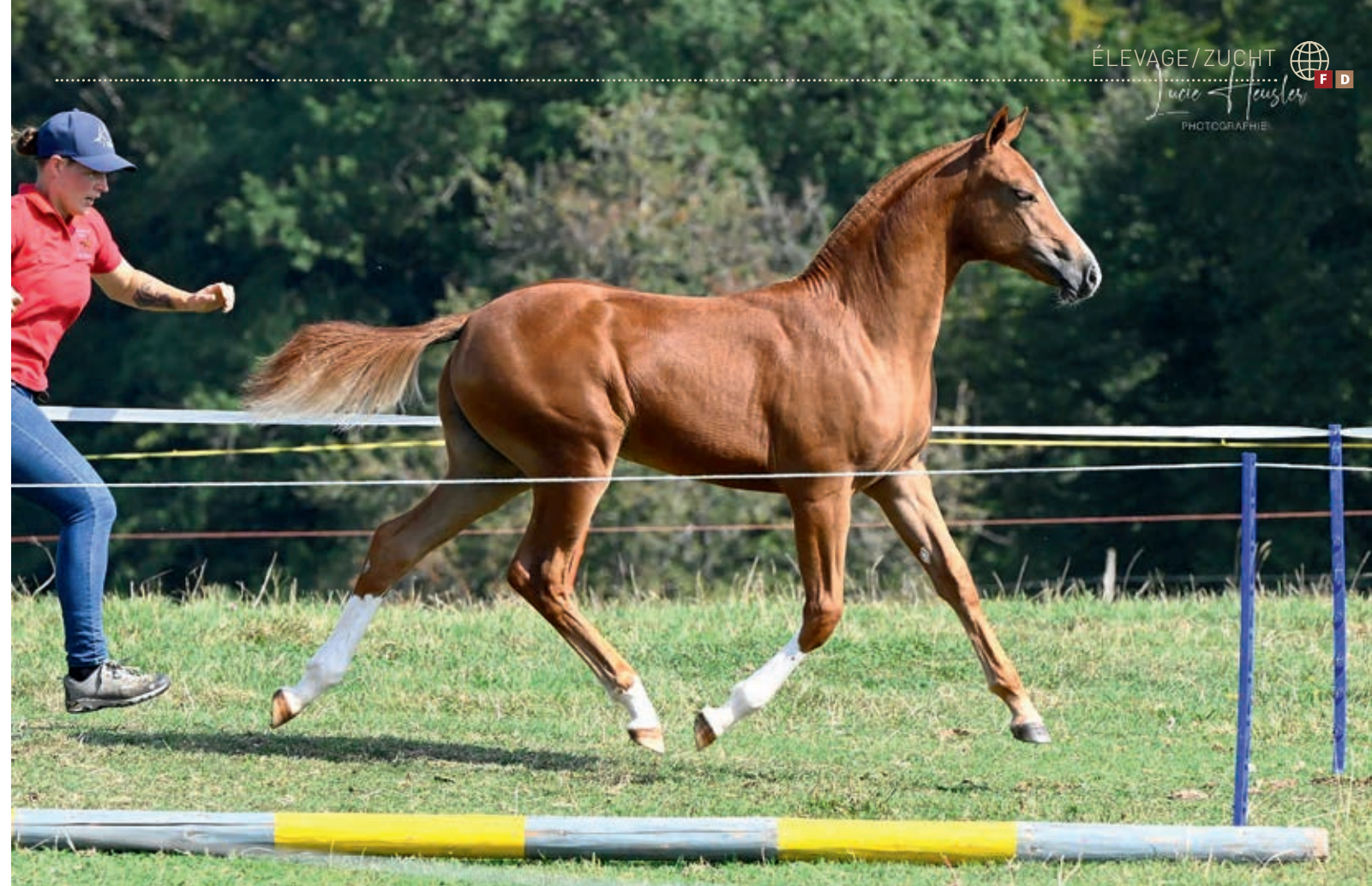
Gewinnerin der Kategorie der älteren Fohlen: Chiquitah (Edoras/Never BW). / Gagnante de la catégorie des pouliches et poulains plus âgés: Chiquitah (Edoras/Never BW).

quarante présentés qui ont obtenu leur ticket pour la finale de l'après-midi. Une belle cuvée, avec un minimum de 22 points nécessaires pour une place au rappel.