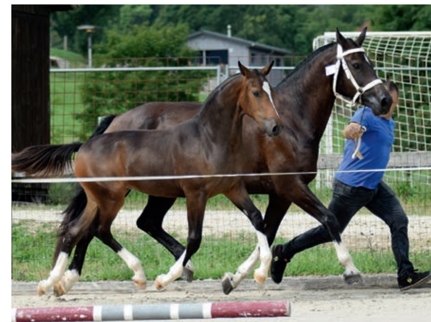
Heure de la Suze (Horizon des Oués/Hayden PBM) gewann in der Kategorie der Stutfohlen. / Heure de la Suze (Horizon des Oués/Hayden PBM) s'est imposée dans la catégorie des pouliches.

17 août 2024 – Syndicat d'élevage chevalin Tramelan-Erguël à St-Imier