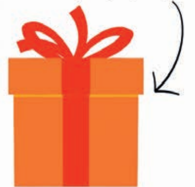
CADEAU FM SURPRISE FM ÜBERRASCHUNGSGESCHENK