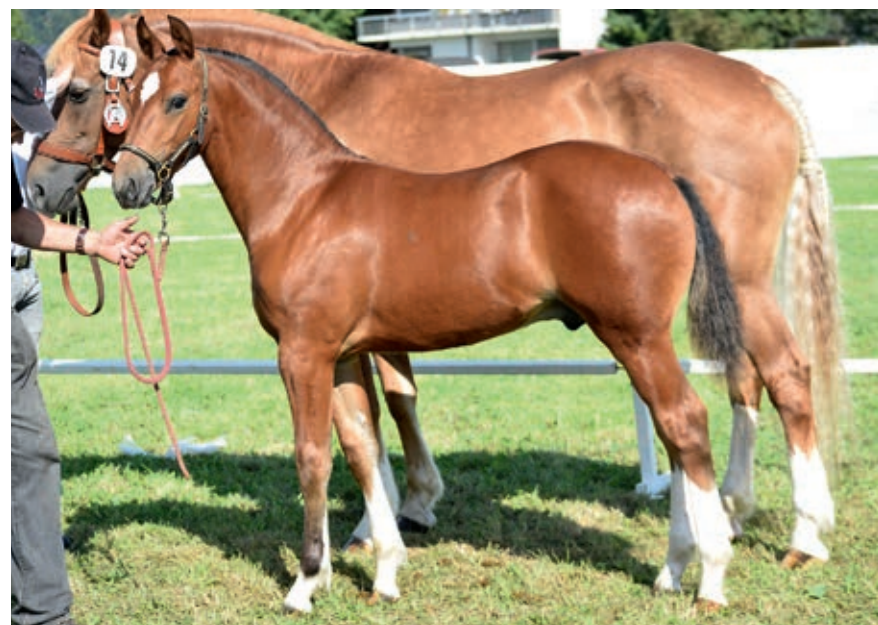
Havano (Haloa/Naguar) a décroché la seconde place du podium. / Havano (Haloa/Naguar) belegte den zweiten Platz auf dem Podest.

24 août 2024 – Syndicat d'élevage chevalin Seeland-Laupen à Worben